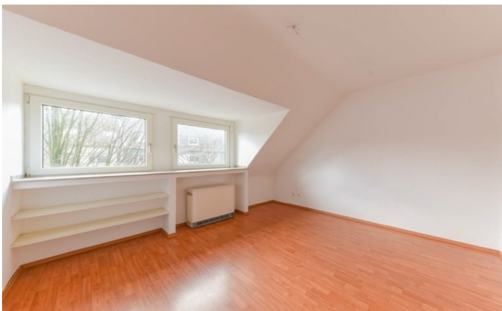
Arbeits- oder Kinderzimmer