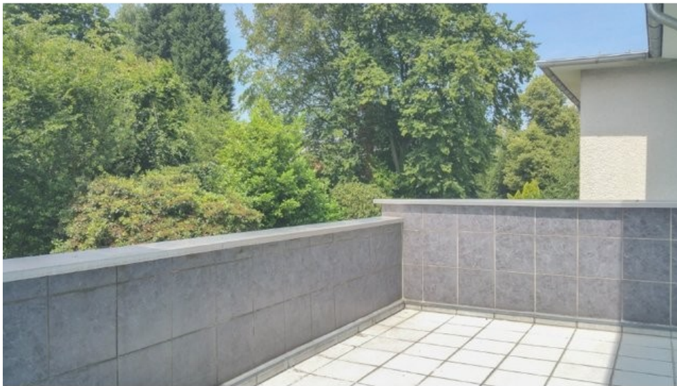
Sonnenterrasse mit Süd-West Ausrichtung und Blick ins Grüne