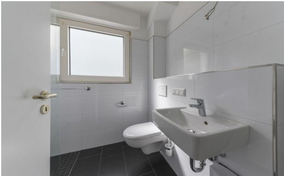
Blick in das Tageslichtbad