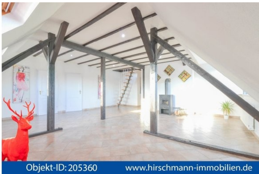
Big City Life