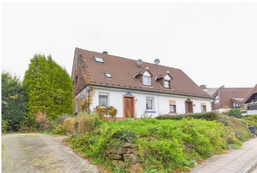
Doppelhaushälfte mit Anbauoption