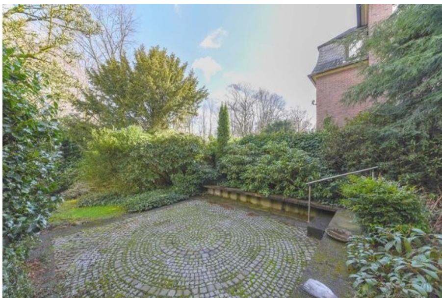
Perfekt für den Sommer