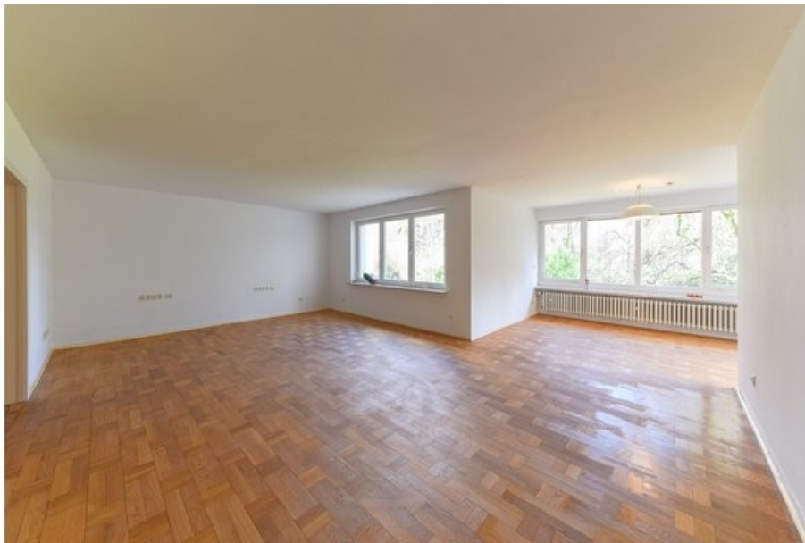
Weitere Ansicht vom Wohnbereich