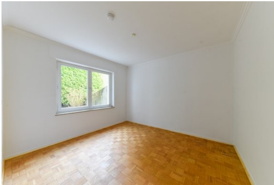
Home-Office oder Gästebereich