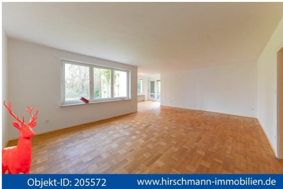
Traumhafter großer WohnbereichBanner