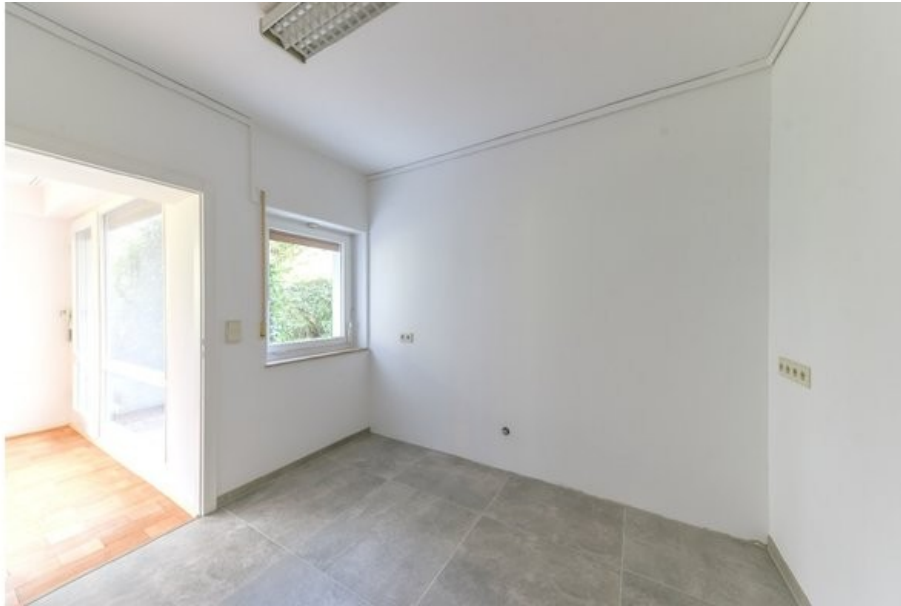
Küche mit Blick in den Essbereich