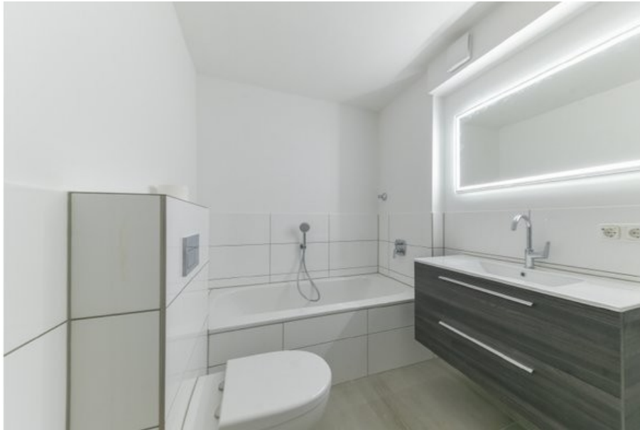
Schick gestaltetes Badezimmer