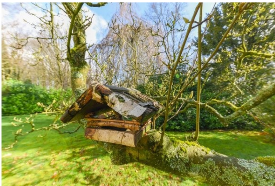
Der Frühling kommt