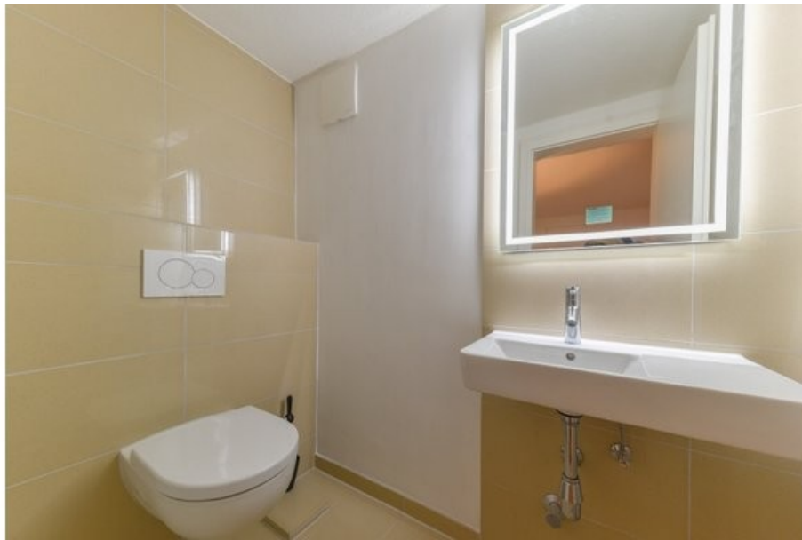
Frisch renoviertes Gäste-WC