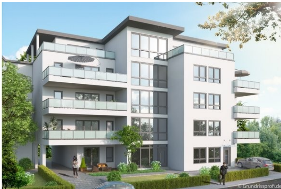
Hirschmann - Bahnhofstr_HQ