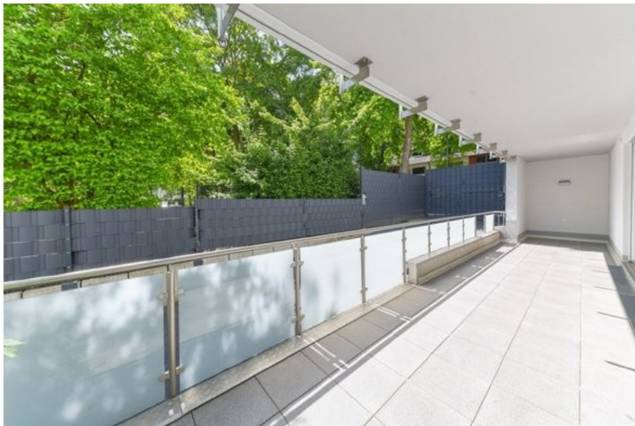
Ihr zukünftiger Sonnenplatz