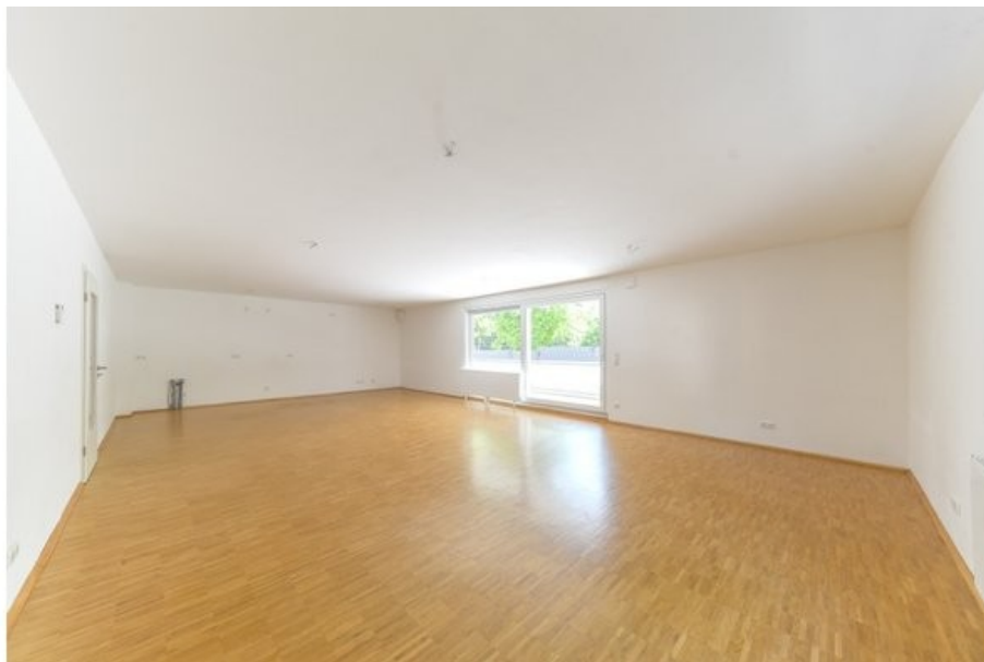
großzügiger Wohnbereich mit offener Küche