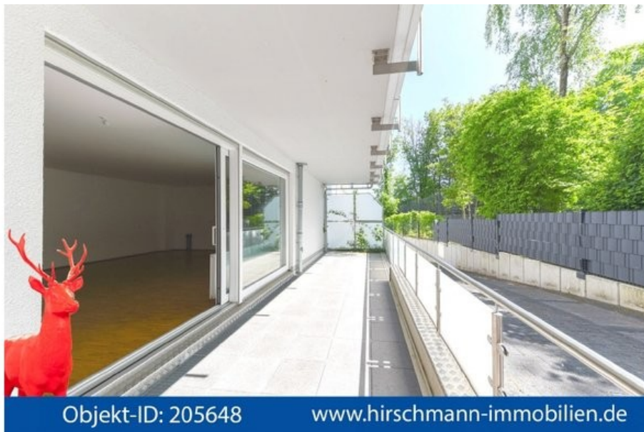
Balkon mit Blick ins WohnzimmerBanner