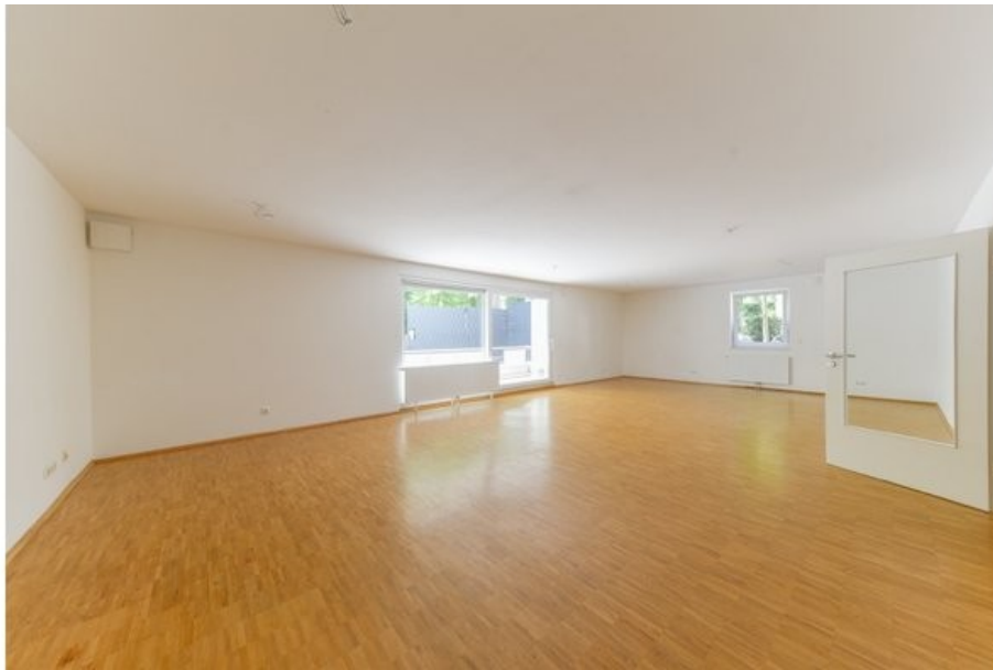
weitere Ansicht Wohnbereich