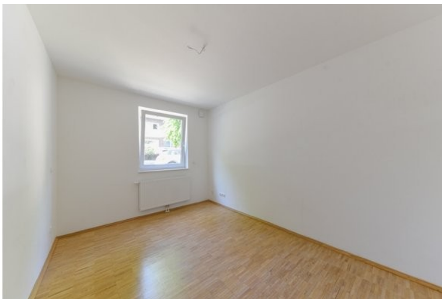
Ihr persönliches Home-Office