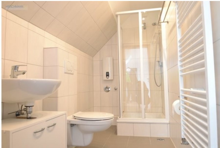
Duschbad mit Handtuchheizkörper