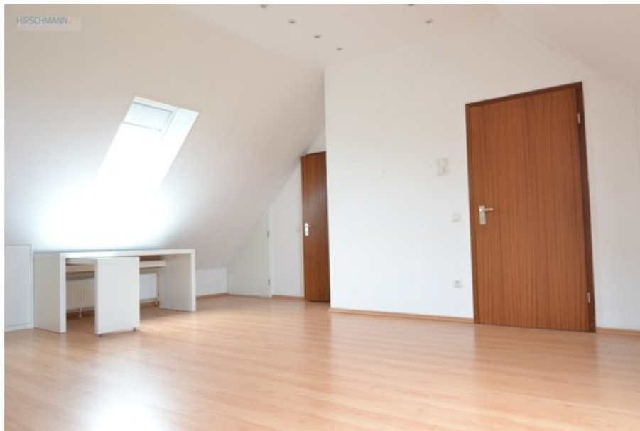
Wohn- und Schlafbereich