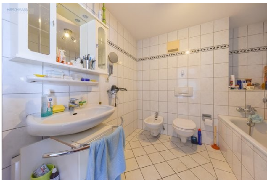
Badezimmer mit Bide