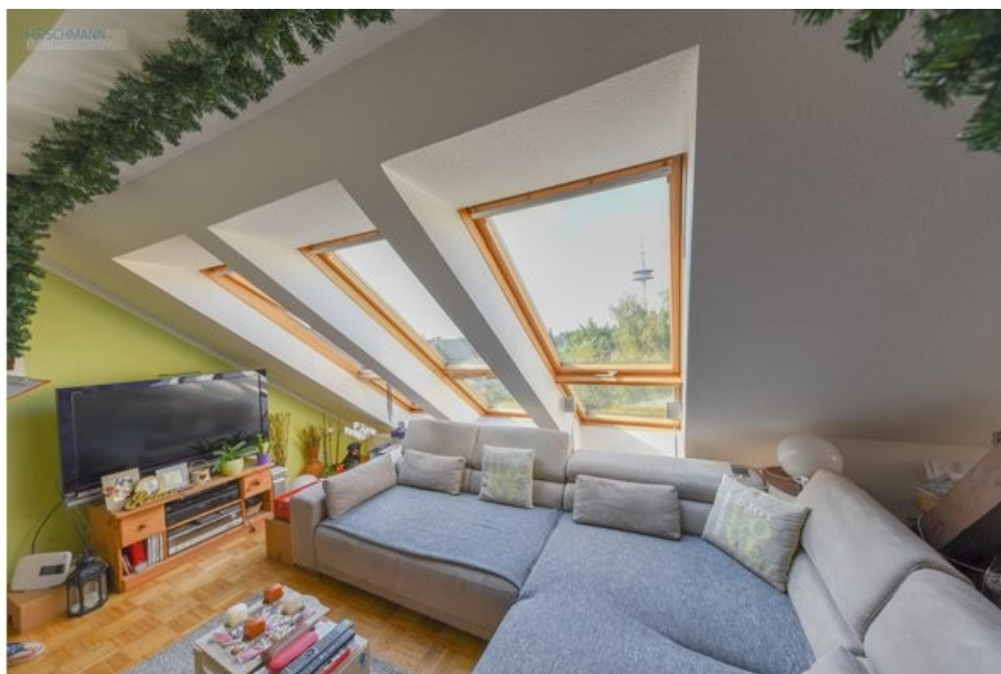
Weitere Ansicht Wohnbereich