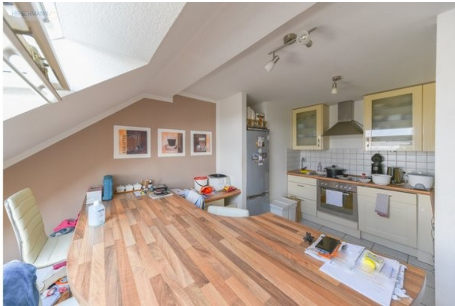
Küche mit Essbereich