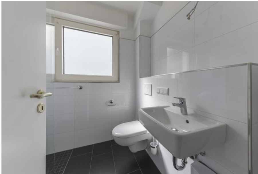
Blick in das Tageslichtbad