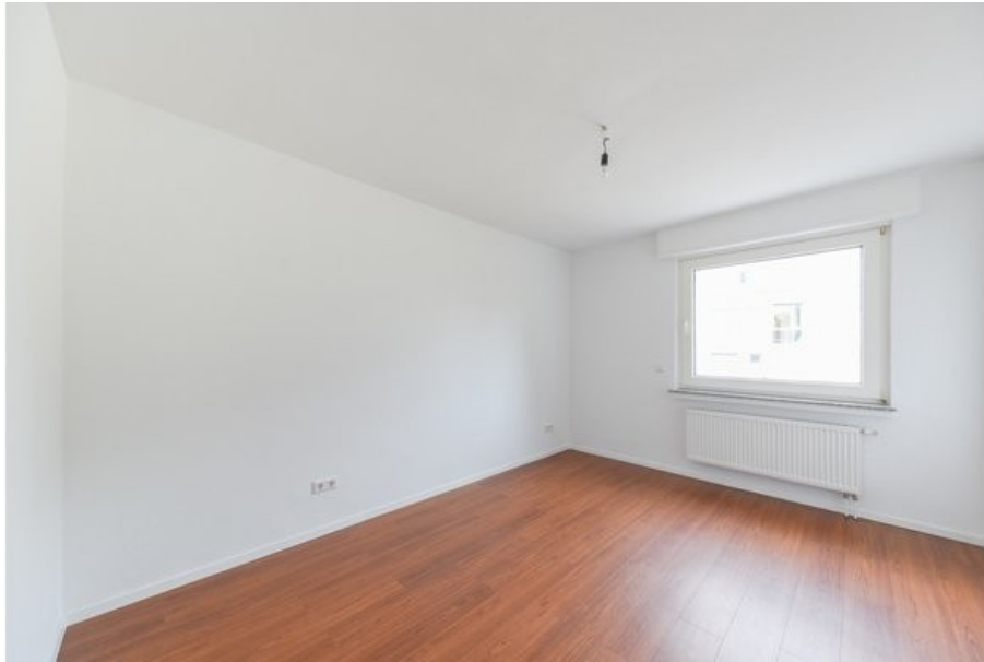
Ihr zukünftiges Schlafzimmer