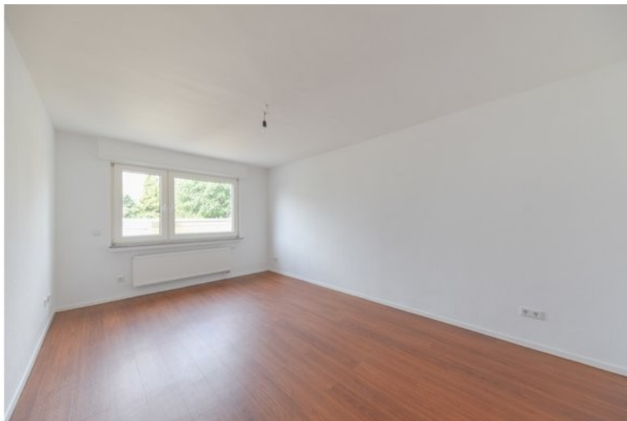
weitere Ansicht vom schicken Wohnbereich