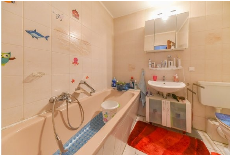
Familienbadezimmer mit Wanne