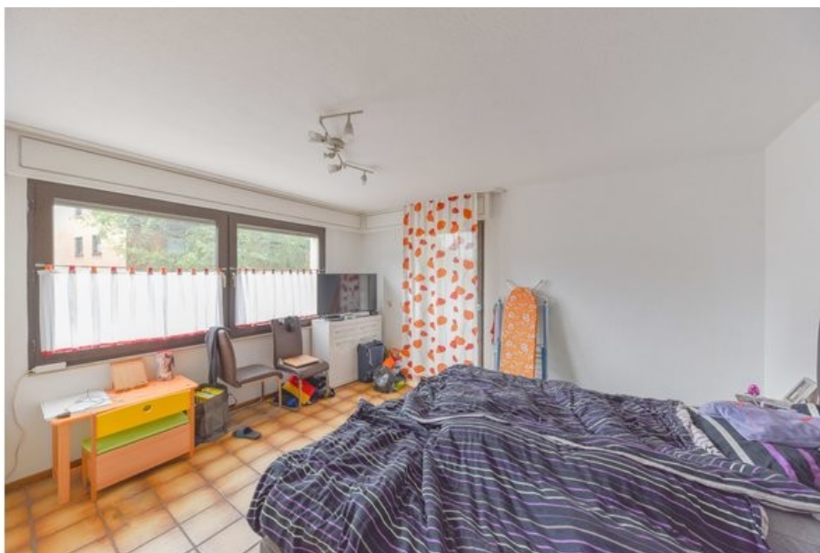
Schlafzimmer mit Zugang zum Balkon