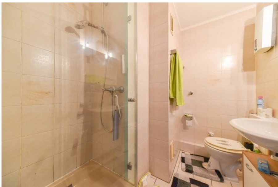
Gäste-WC mit Dusche