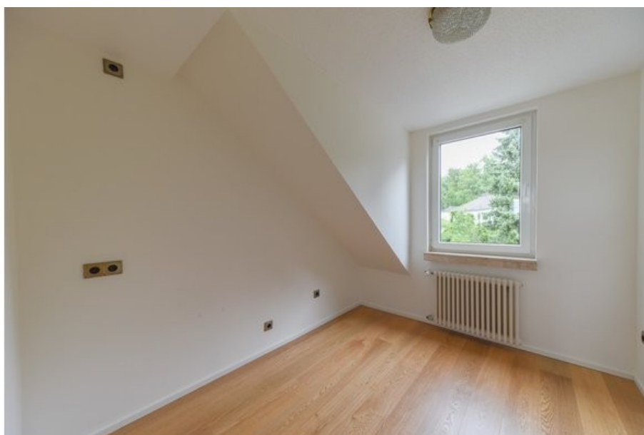
Viel Platz für das Home-Office