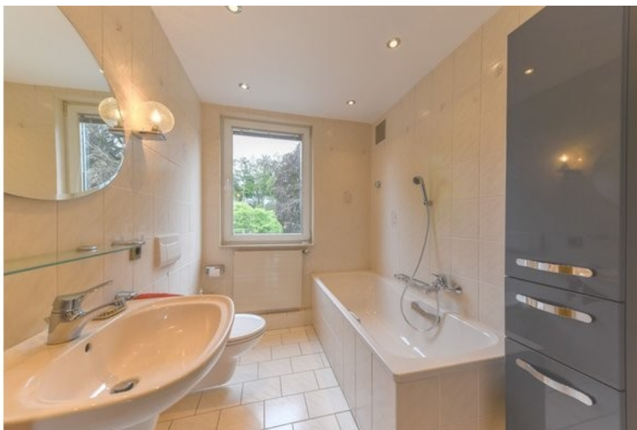
Ihr kleine Ruheoase