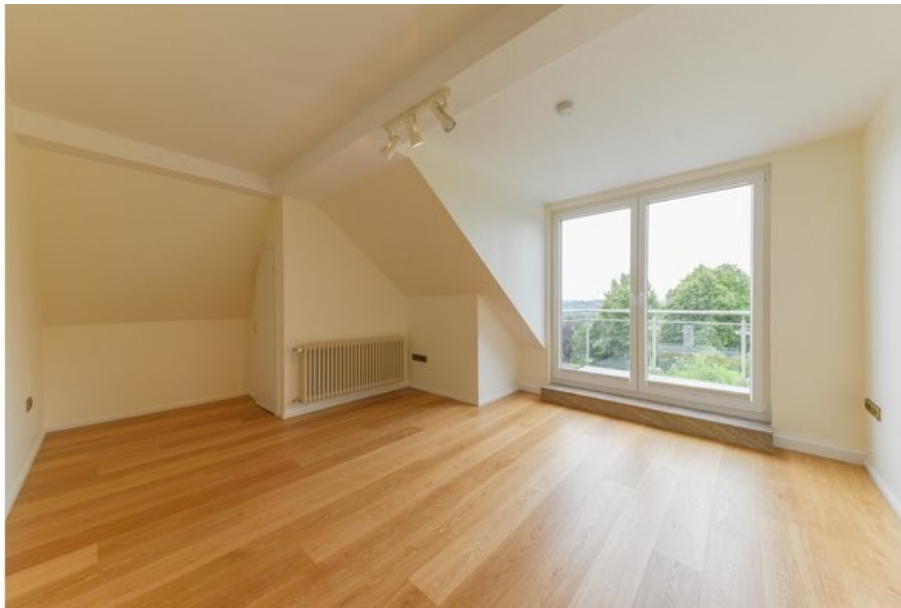
Ihr baldiger Schlafbereich