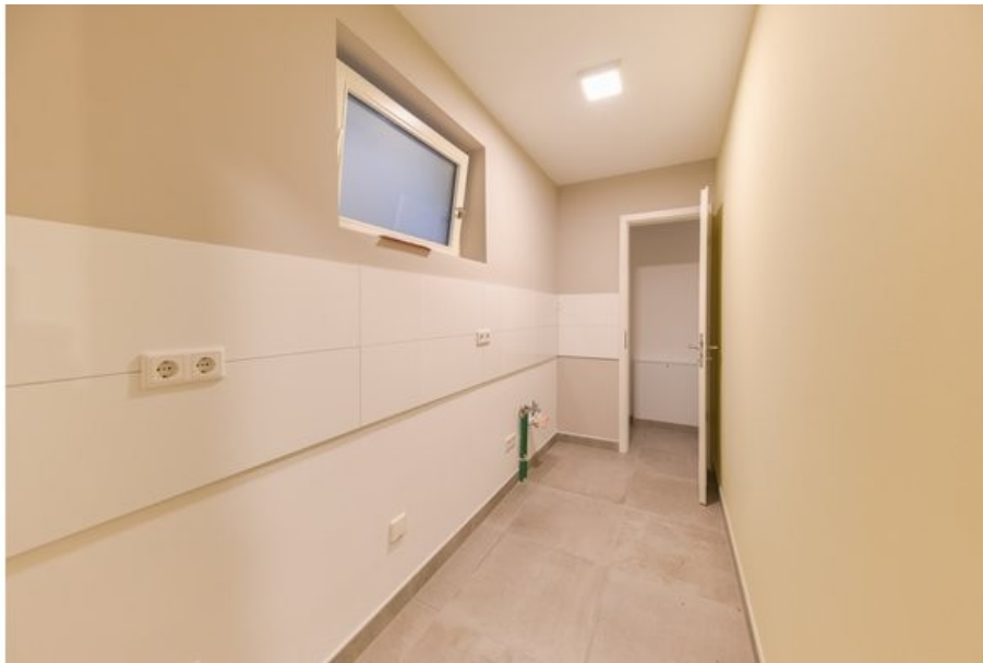
Separate Küche mit integrierter Abstellkammer