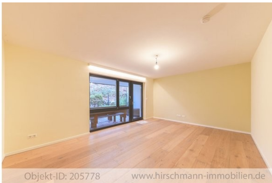
Happy in Heisingen!