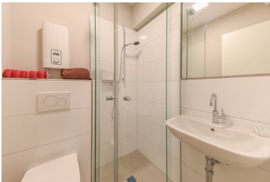
Modernes Bad mit bodentiefer Dusche