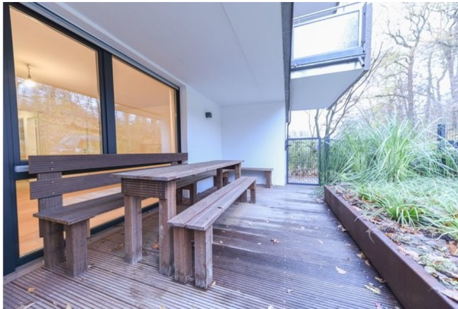
Ihre eigene Terrasse