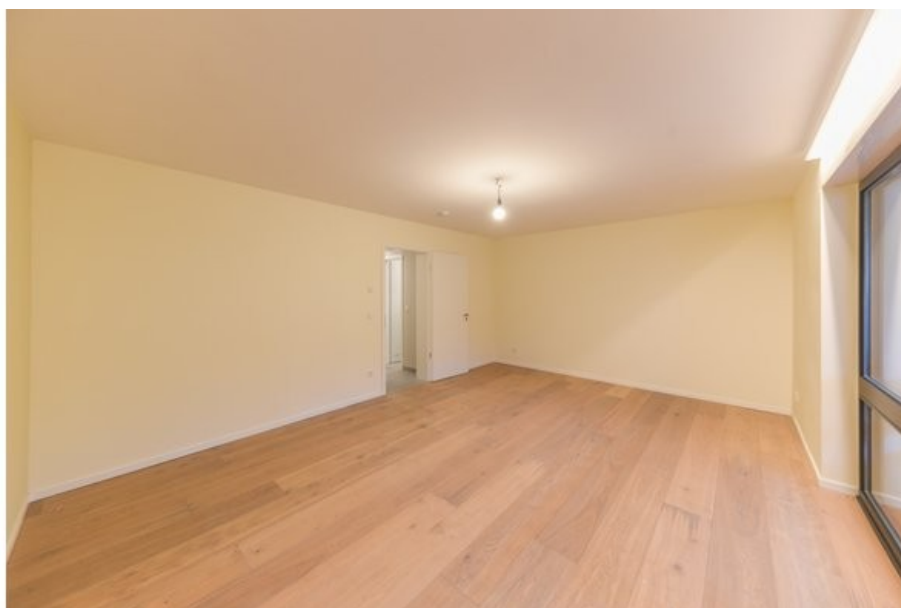
Weitere Ansicht des Wohnraumes