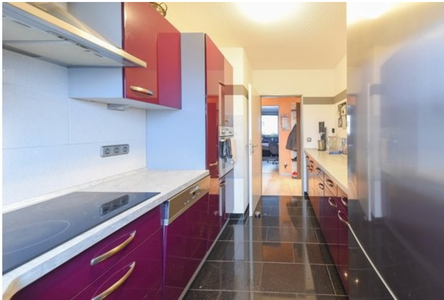
Küchenbereich mit Einbauküche