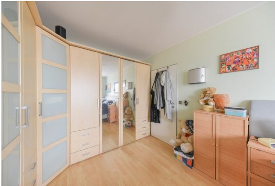
Viel Platz auch für einen Kleiderschrank