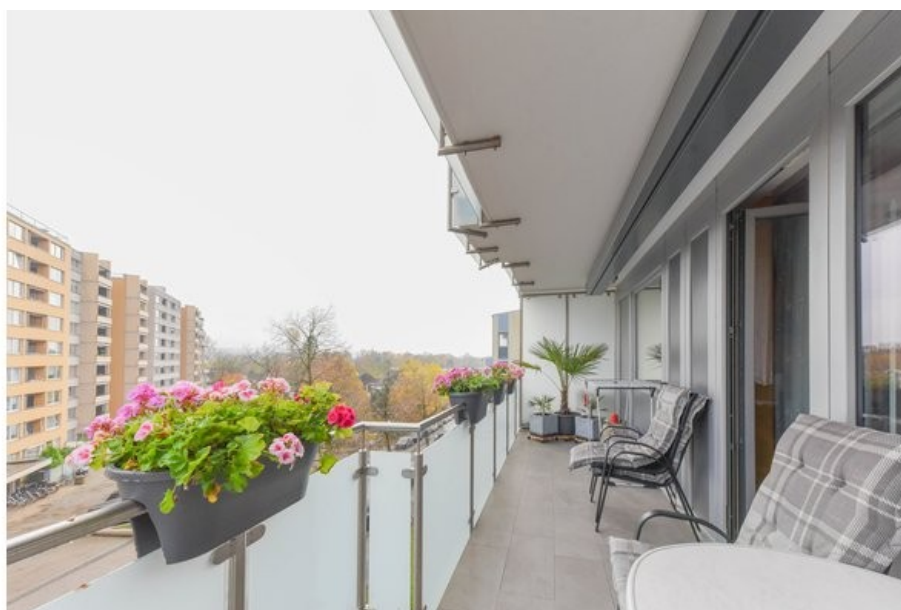
Schöner Blick ins Freie.