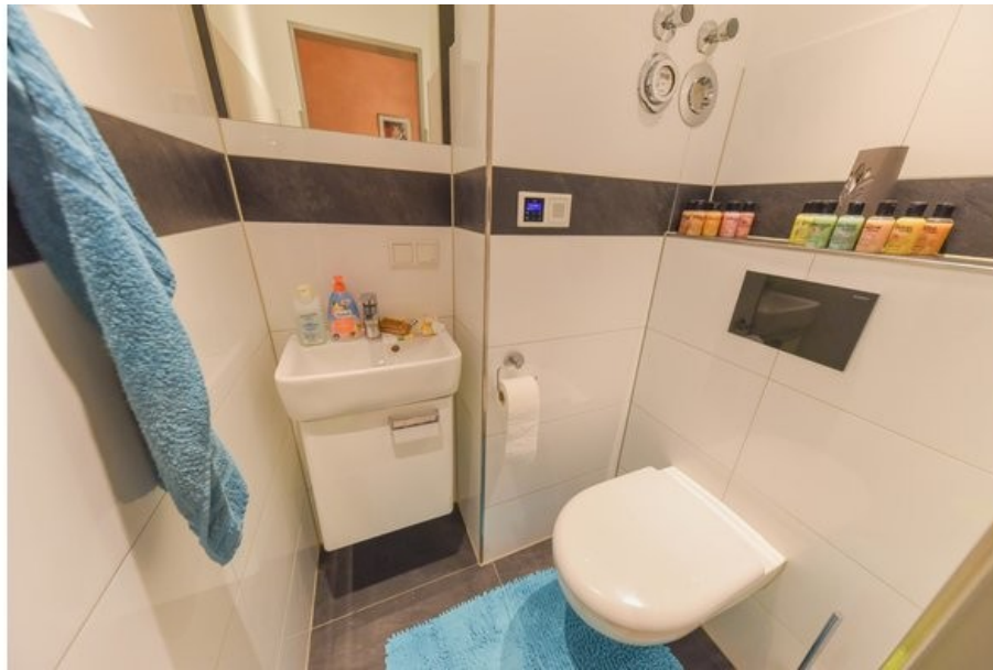
Gäste-WC mit integriertem Radio