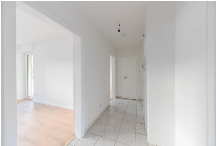
Zugang zum Wohnzimmer