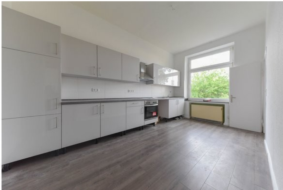
Küche mit hochwertiger Einbauküche