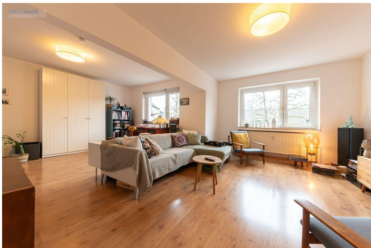
Blick in den Wohnbereich